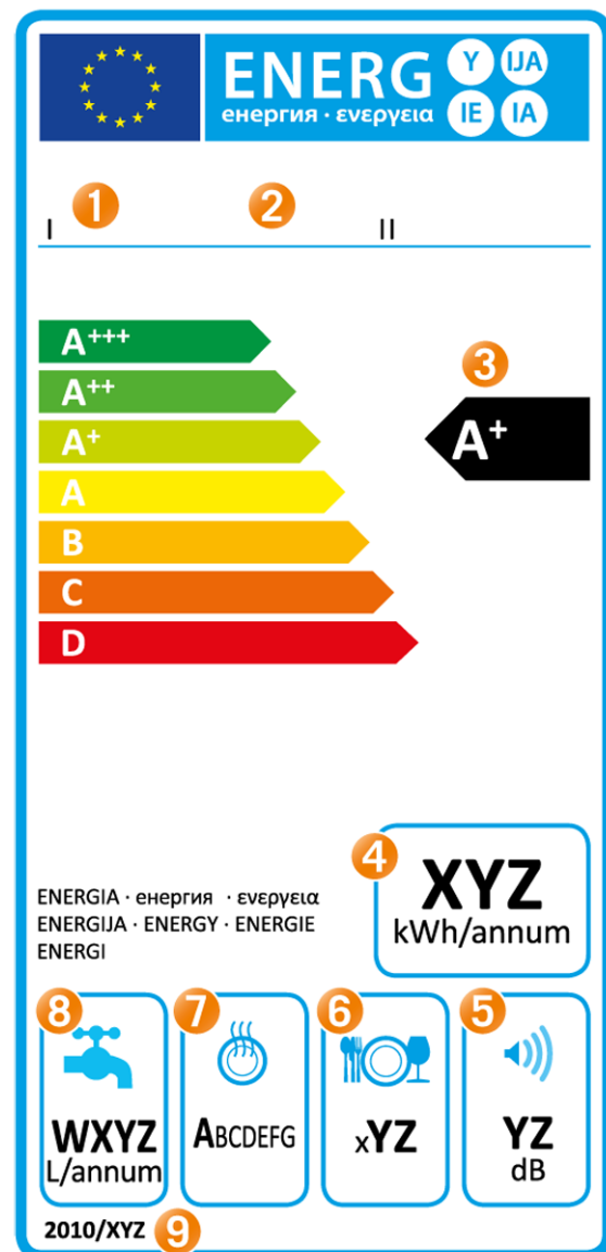
Abbildung: Fachverband Elektroapparate für Haushalt und Gewerbe Schweiz (FEA)